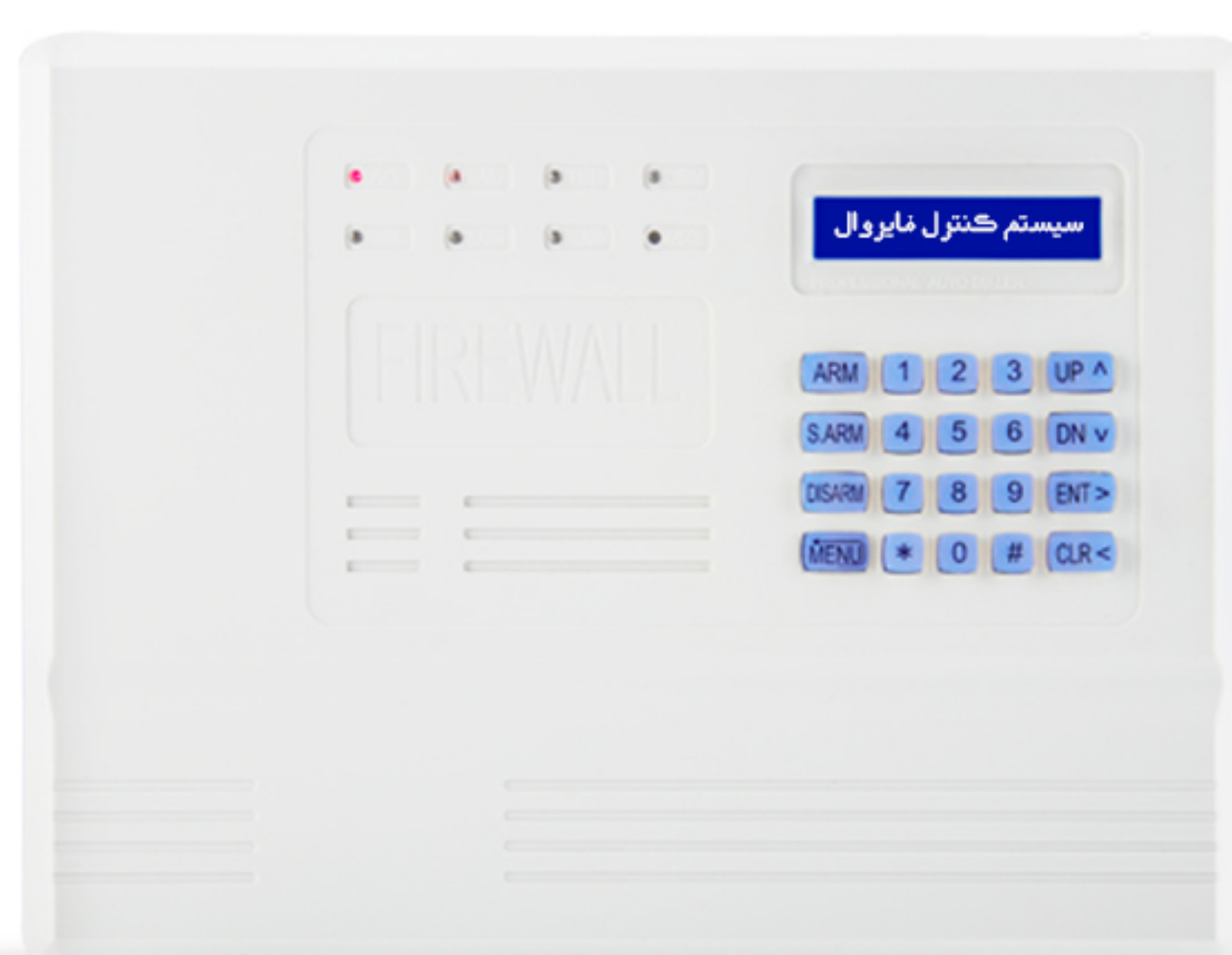
دزدگیر اماکن F9