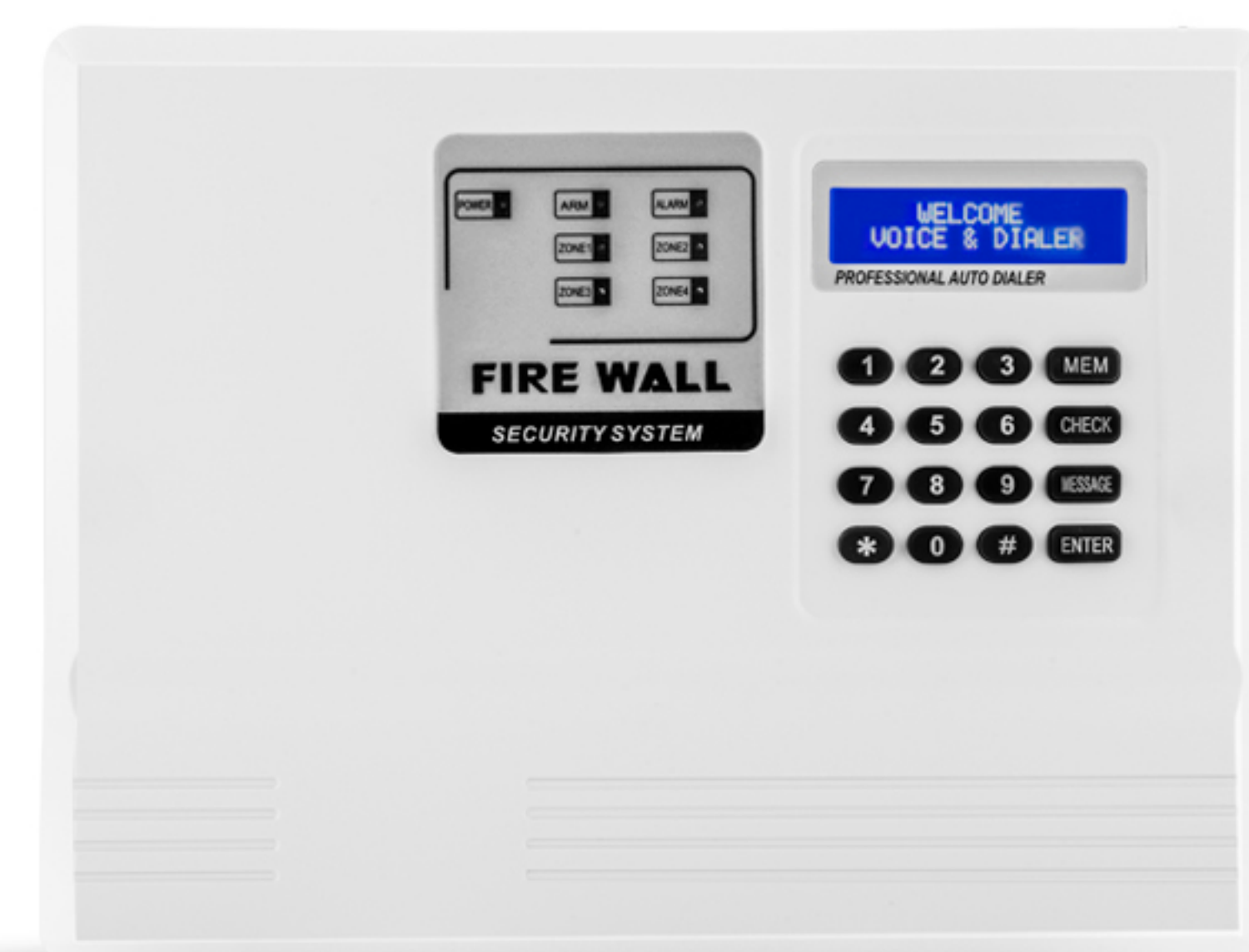
دزدگیر اماکن F7